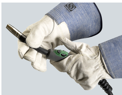
ML 161-241 - Špičkové ergonomické hořáky s možností otočení krku o 360°.

Hořák MIG-A Twist® odstraňuje nevýhody tradičního otočného krku. Rukojeť se otáčí kolem krku – nikoli naopak. Nedochází k opotřebení O-kroužků ani k riziku netěsností, přičemž je zachována neomezená pohyblivost: plynem chlazené hořáky lze otočit o 90° v obou směrech, vodou chlazené o 45°. Hořák MIG-A Twist® je rovněž vybaven kulovým kloubovým spojem mezi hadicí a rukojetí hořáku – a uživatelsky přívětivou spouští s měkkým dorazem s možností nastavení dlouhého nebo krátkého pohybu.